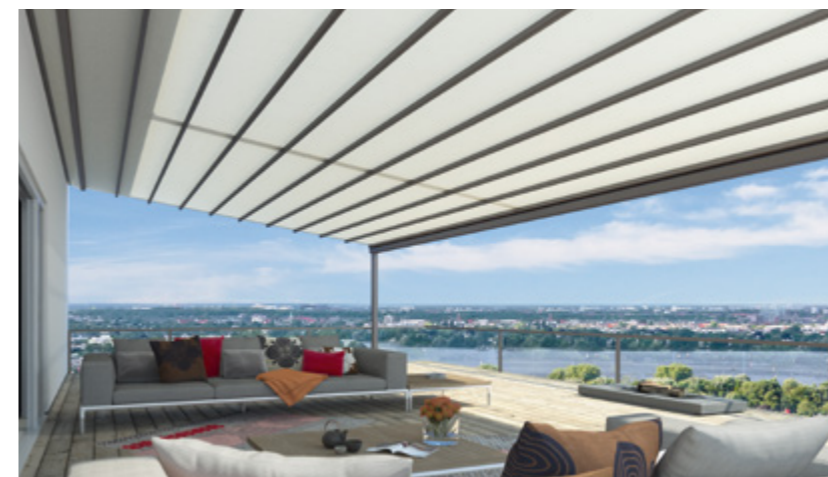
Gestellfarbe WT 029/70786 | Dessin Pergona® transluzent PE 90W (Weiß)

Das Besondere an weinor Pergona® transluzent ist die hohe Lichtdurchlässigkeit von bis zu 21 %. Natürliches Licht dringt durch das regendichte Trägergewebe, gleichzeitig verhindert es unangenehme Blendung durch die Sonne. Hochfeste Polyesterfäden machen das Gewebe äußerst widerstandsfähig, langlebig und wetterbeständig.