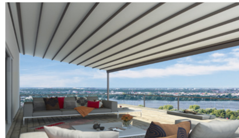
Gestellfarbe WT 029/70786 | Dessin Pergona® classic PE 140 (Weiß)

Das PVC-beschichtete Tuch weinor Pergona® classic leitet Regenwasser zuverlässig ab. Die Tücher sind nahezu blickdicht und eignen sich daher ideal zum Verdunkeln. Auch Verschmutzungen sind von unten nicht sichtbar.