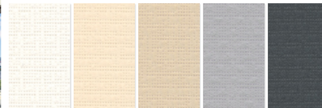
PE 90W (Weiß) PE 100W (Creme) PE 110W (Beige) PE 120W (Grau) PE 130W (Anthrazit)