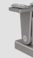
Stützfuß top für Reihenanlagen, verstellbar, in 3 Höhen: 120–165, 165–210 und 210–255 mm