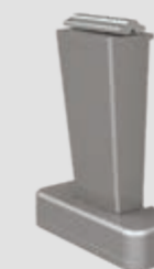
Stützfuß top, fest, in 4 Höhen: 80, 120, 150 und 220 mm

WGM Top gibt es in den Versionen Stretch und OptiStretch , die für ein straffes Tuch sorgen. Bei der Ausführung OptiStretch ist das Tuch an allen vier Seiten fest gespannt. Die Vorteile: ein besonders straffes Tuch und kein Lichtspalt an den Seiten. Die Basis-Version Stretch ist 2-seitig gespannt und es gibt einen Lichtspalt zwischen Tuch und Seitenprofil. Bei beiden Varianten sorgt ein kraftvolles Seilspannsystem für einen gleichmäßigen Tuchstand.