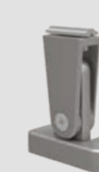
Stützfuß top, verstellbar, in 3 Höhen: 120–165, 165–210 und 210–255 mm